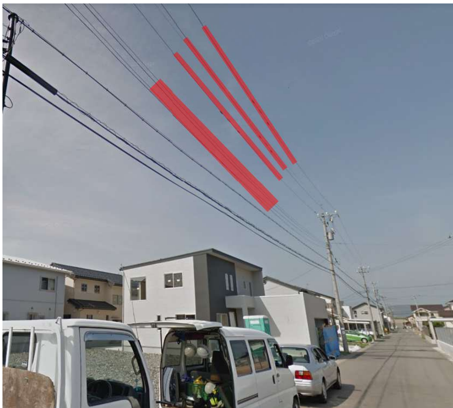
現地写真_記載例① 建物建築等クレーン使用时