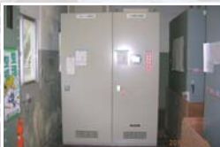
新励磁装置の据付後