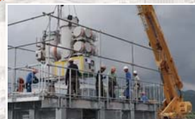
ガス絶縁開閉装置新設工事