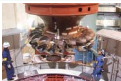
水車分解組立点検