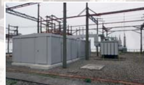
変圧器・キュービクル更新工事