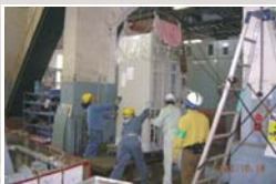
新励磁装置の据付作業