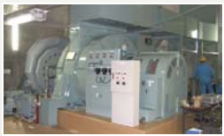
施工後の水車・発電機