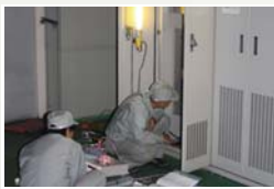
调速機・励磁装置制御盤 点検・試験