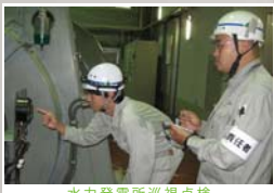
水力発電所巡視点検